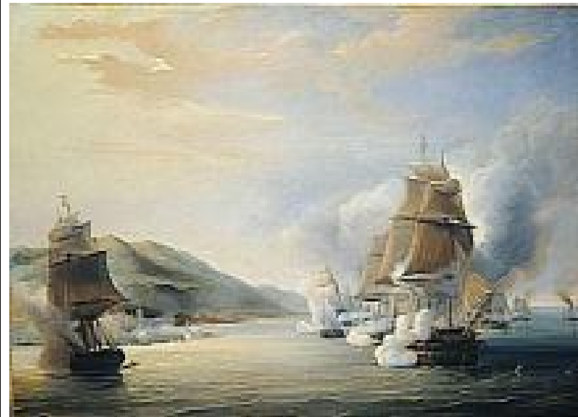
الحملة الفرنسية على الجزائر