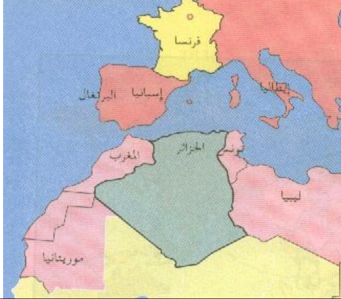
إستراتيجية موقع الجزائر