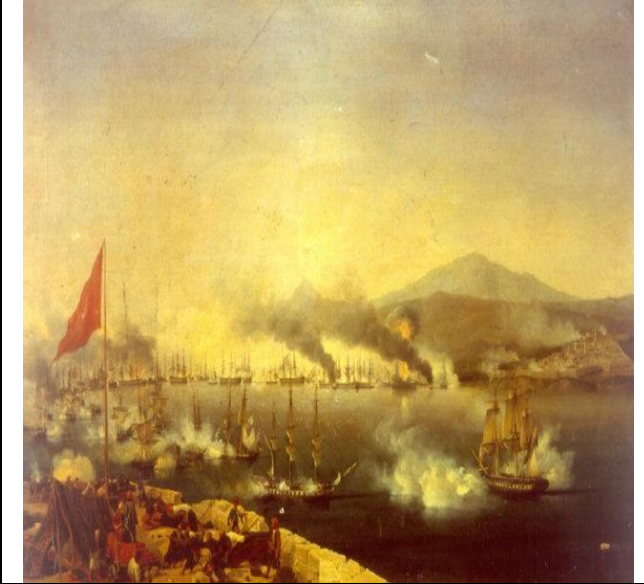
معركة نافرين و تحطم قوة الجزائر الدفاعية