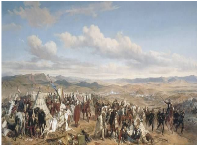
لوحة فرنسية لأحد المعارك